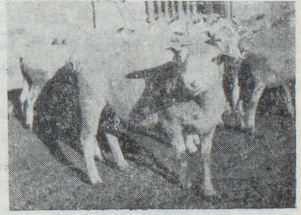
RESİM : 2

Ile de Franse koyunu kuzusu ile birlikte.