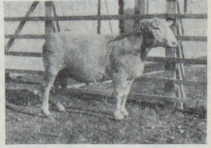
RESİM : 4