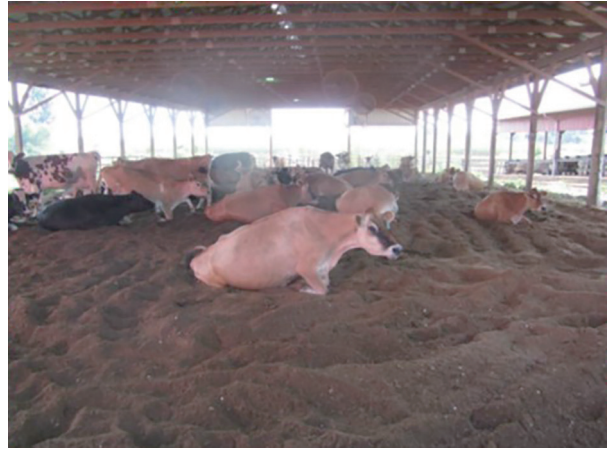
Şekil 13. İyi yönetilen bir kompost altlıklı barınak ineklerin doğal davranışlarını göstermesini ve kuru dinlenme alanı sağlayarak ayak, bacak ve meme sağlığının korunmasına yardımcı olur [11]