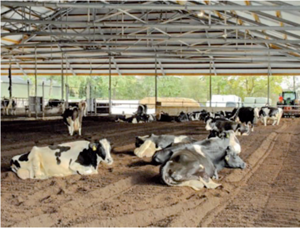
Şekil 3. Hollanda'da kompost altlıklı bir barınak [22]