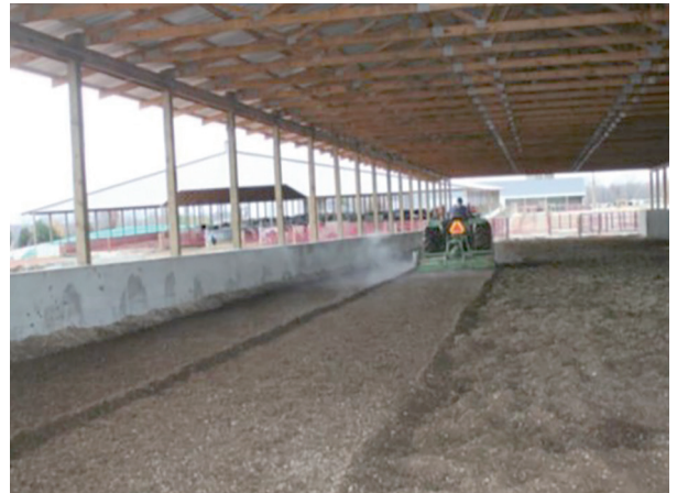
Şekil 7. Kompost altlığın karıştırılması [39]