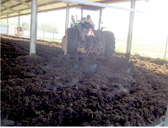
Şekil 8. Kompost altlığın karıştırılarak havalandırılması ve buharlaşması [39]