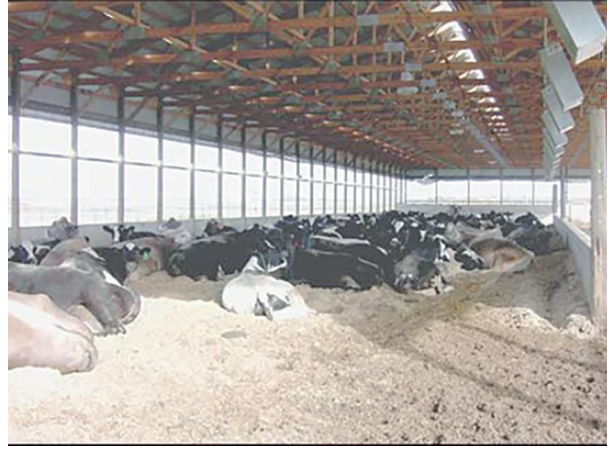
Şekil 12. Kompost altlıklı bir barınakta dinlenen inekler [1]