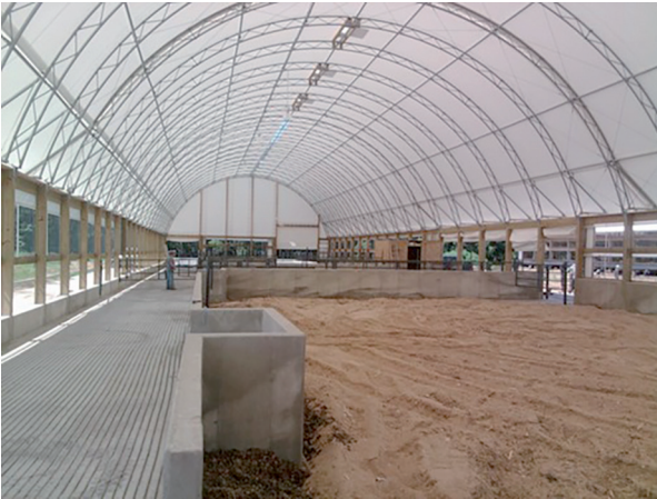
Şekil 10. Örnek bir kompost altlıklı barınak [4]