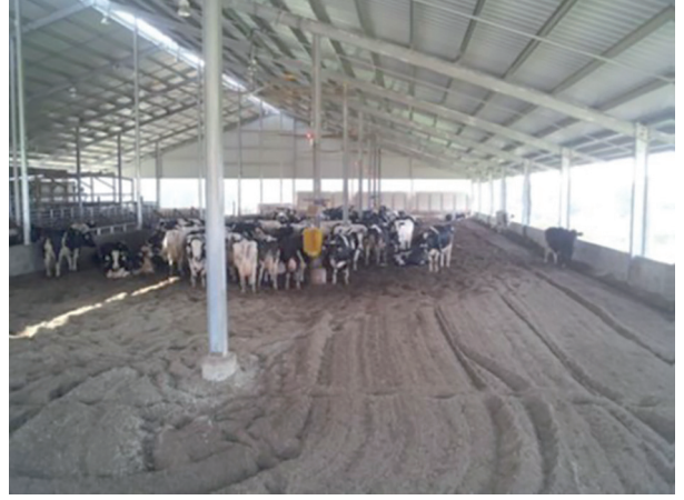
Şekil 11. Sıcaklık stresinde ineklerin hava akımı olan bir yerde toplanması [38]