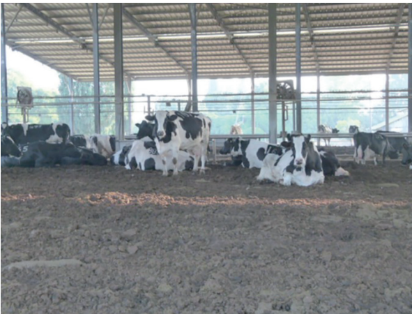
Şekil 4. İsrail'de gübre kompost altlıklı barınak [5]