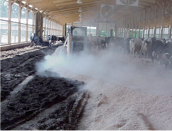
Şekil 9. İnekler barınakta iken altlığın karıştırılması [6]