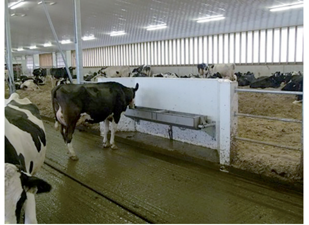
Şekil 6. Suluklar, kompost altlık dışına yerleştirilerek altlığın ıslanmasının önüne geçilir [25]