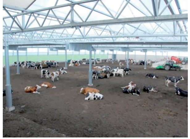
Şekil 5. Hollanda'da sağlam konstrüksiyonlu kompost altlıklı bir barınak [22]